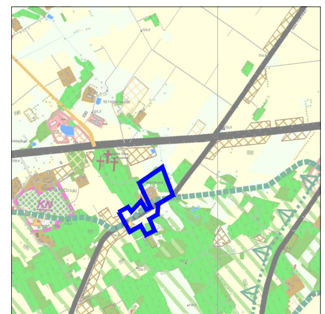
KIERUNKI ZAGOSPODAROWANIA PRZESTRZENNEGO