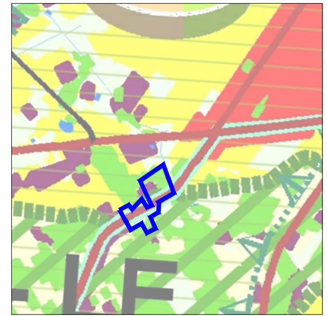
KIERUNKI KSZTAŁTOWANIA STRUKTURY PRZESTRZENNEJ OBSZARÓW FUNKCYJNALNYCH