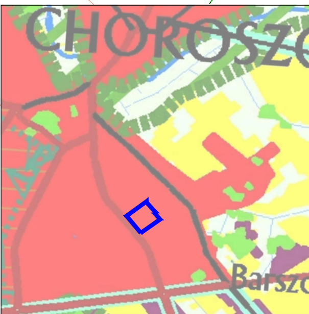
KIERUNKI KSZTAŁTOWANIA STRUKTURY PRZESTRZENNEJ OBSZARÓW FUNKCYJNALNYCH