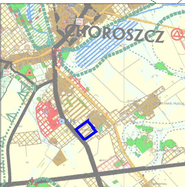
KIERUNKI ZAGOSPODAROWANIA PRZESTRZENNEGO