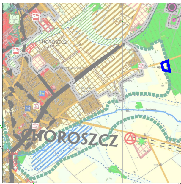
KIERUNKI ZAGOSPODAROWANIA PRZESTRZENNEGO