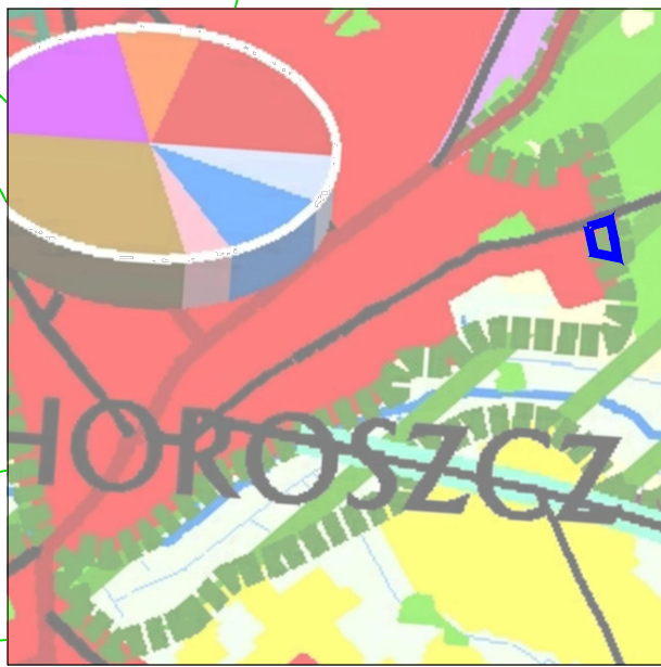
KIERUNKI KSZTAŁTOWANIA STRUKTURY PRZESTRZENNEJ OBSZARÓW FUNKCJONALNYCH