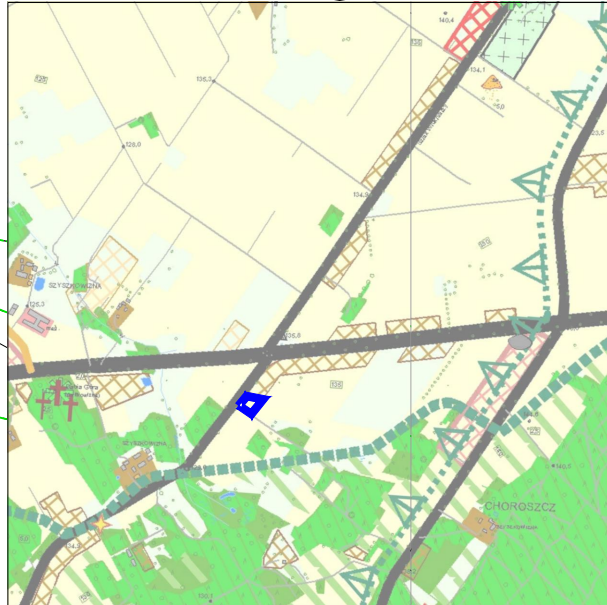
KIERUNKI ZAGOSPODAROWANIA PRZESTRZENNEGO