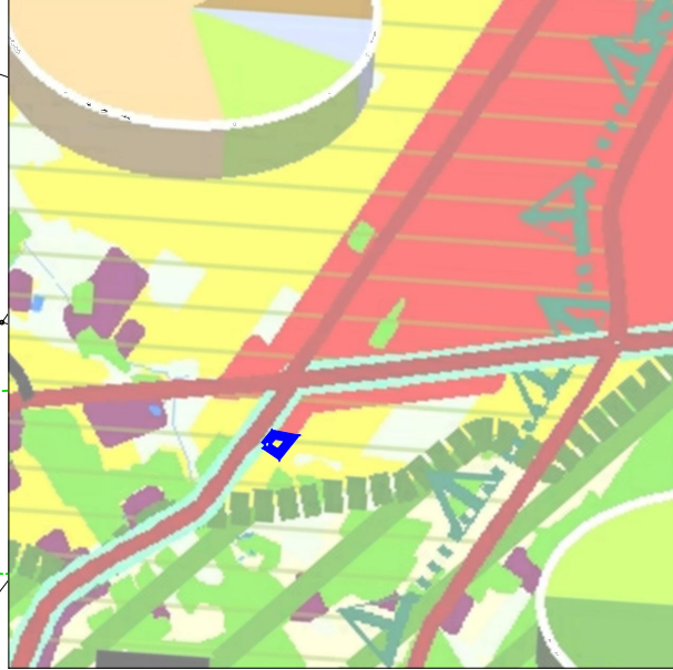
KIERUNKI KSZTAŁTOWANIA STRUKTURY PRZESTRZENNEJ OBSZARÓW FUNKCJONALNYCH