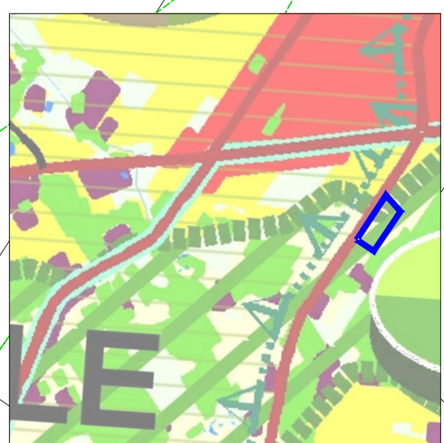
KIERUNKI KSZTAŁTOWANIA STRUKTURY PRZESTRZENNEJ OBSZARÓW FUNKCJONALNYCH