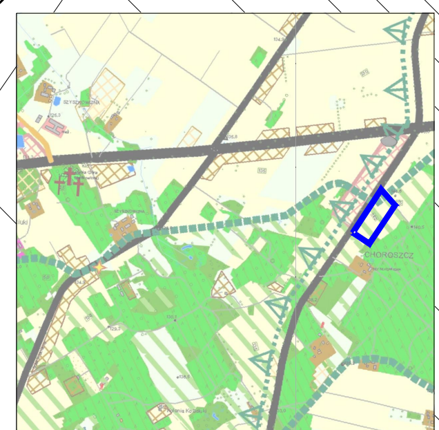
KIERUNKI ZAGOSPODAROWANIA PRZESTRZENNEGO